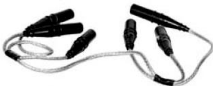
Рис.1. Устройство для закорачивания М6D