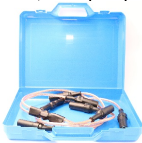
Рис.1. Устройство для закорачивания М6D

*Изготовитель оставляет за собой право вносить изменения в конструкцию и комплект поставки, не ухудшающие его характеристик.